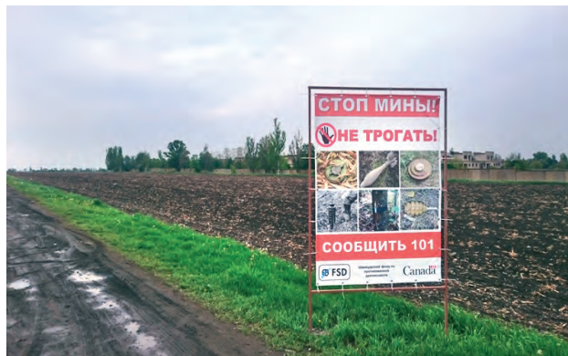
↑ Банери уздовж дороги до КПВВ «Мар'їнка»

На території довкола КПВВ встановлені таблички, які попереджають людей про мінну небезпеку. Крім того, уздовж дороги, яка веде до в'їзду на КПВВ, встановлені інформаційні банери про мінну небезпеку в кількості шість штук по обидві сторони дороги на деякій відстані — приблизно 1 км — один від одного.