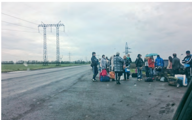
↑ Люди під дощем чекають на громадський транспорт до м.Курахово після проходження контролю на КПВВ «Мар'їнка». 7 травня 2016 року.