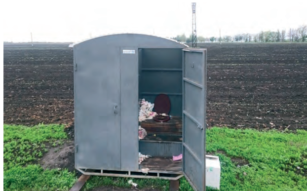
↑ Туалети, КПВВ «Мар'їнка»

Намети ДСНС «для обігріву» та відпочинку розташовані в 2-х кілометрів від КПВВ, що робить їх майже непомітними для більшості подорожуючих. У розмові люди зізнавались, що і не підозрювали про їхнє існування.