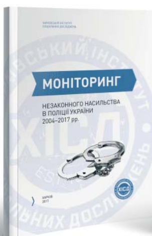
Моніторинг незаконного насильства в поліції України (2004–2017 рр.)