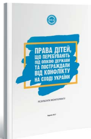
Права дітей, що перебувають під опікою держави та постраждали від конфлікту на сході України