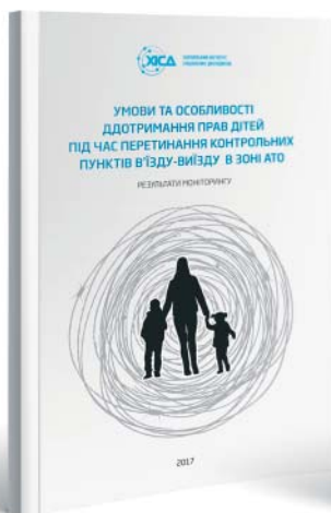
Умови та особливості дотримання прав дітей під час перетинання КПВВ в зоні АТО