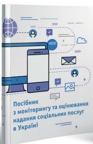
Посібник з моніторингу та оцінювання надання соціальних послуг в Україні