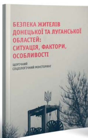
Безпека жителів донецької та луганської областей: ситуація, фактори, особливості