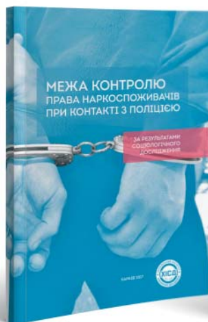
Межа контролю. Права наркоспоживачів при контакті з поліцією