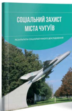
Звіт «Соціальний захист міста Чугуїв. Результати соціологічного дослідження»