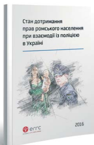
Стан дотримання прав ромського населення при взаємодії із поліцією в Україні