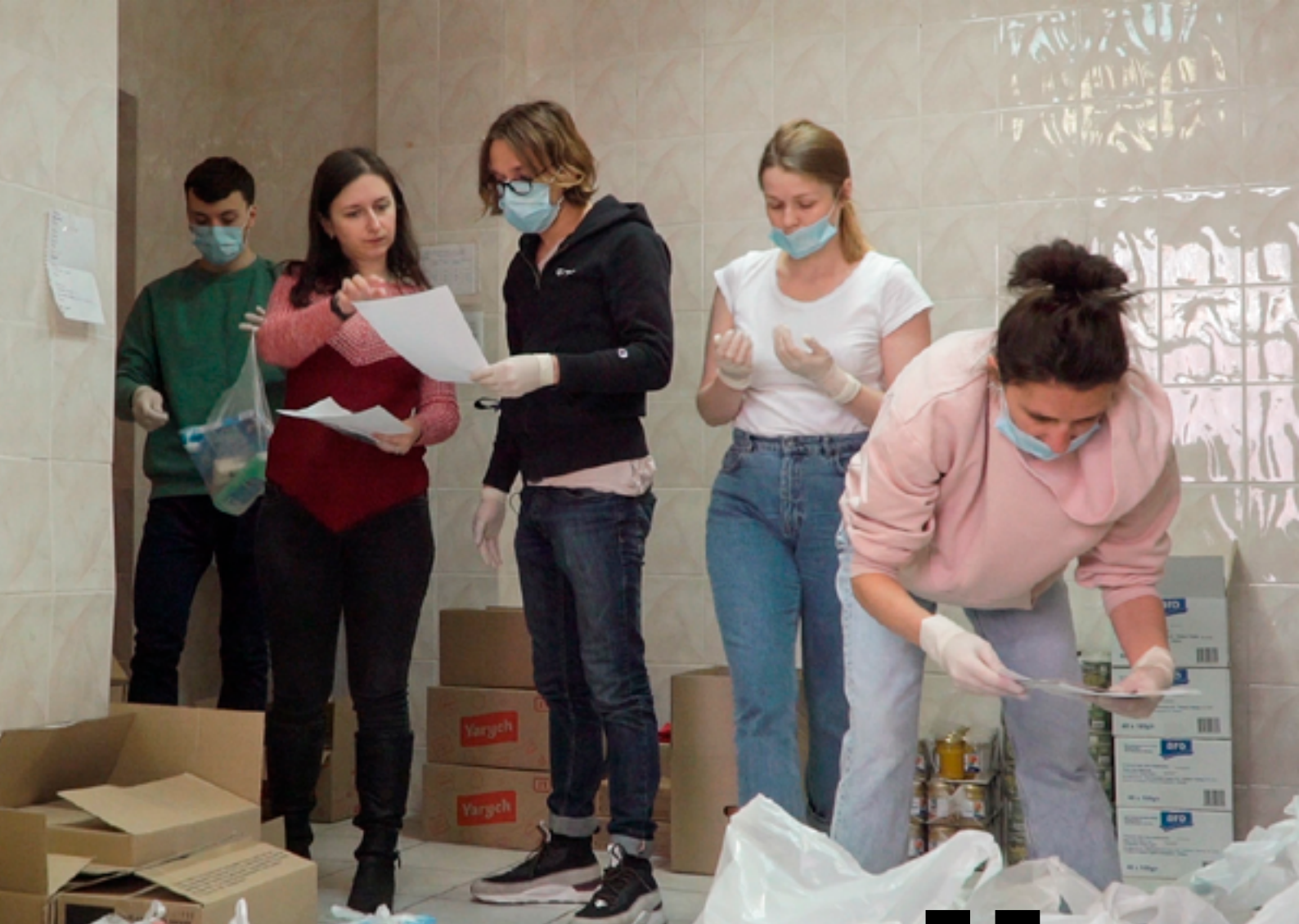
Кадр з відеоісторії про волонтерів, що допомагають людям похилого віку