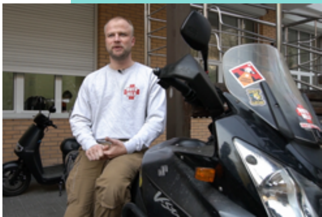
Волонтер MotoHelp, що підвозить лікарів швидкої на роботу. Кадр з відеоісторії