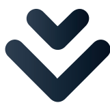
СХЕМА 5. ОБОВ'ЯЗКИ ЖУРНАЛІСТА, ЯКИЙ ОСВІТЛЮЄ ТЕМУ ПЕРЕХІДНОГО ПРАВОСУДДЯ

ПОДАВАТИ ІНФОРМАЦІЮ ТОЧНО ТА ПОВНОЮ МІРОЮ