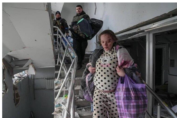
Фото из города Мариуполь 17

21 марта войска РФ обстреляли детскую больницу в Северодонецке. В результате случилось возгорание крыши. Персонал, матерей и детей удалось эвакуировать 18 .