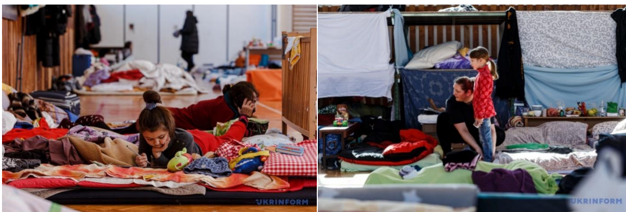
Фото спортивного зала учебного заведения г. Ужгород – временный приют для внутренне перемещенных лиц 39 .

Вместе с тем, ключевой проблемой для перемещенных граждан является поиск более-менее постоянного места проживания, поскольку пункты временного размещения являются приемлемыми только на несколько дней. Жилье в аренду найти практически невозможно или аренда очень дорогая. Из-за этого люди вынуждены искать приют в том числе и за границей. Практически единственным путем найти жилье остается поиск его в населенных пунктах в областях через волонтерские инициативы, где местные жители вызываются добровольно подселить к себе внутренне перемещенных лиц.