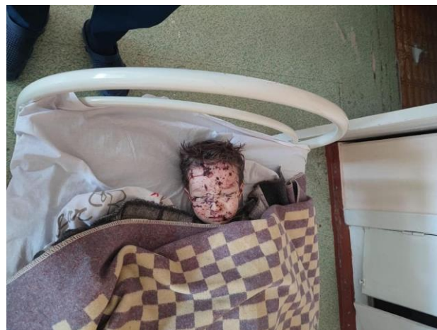
Фото братьев-близнецов, которые пострадали вследствие обстрелов оккупантами больницы в Северодонецке Луганской области 7 .

Однако наиболее страшными являются случаи прямого уничтожения детей со стороны российских оккупантов – расстрелов детей, скидывания бомб на места, где находятся дети.