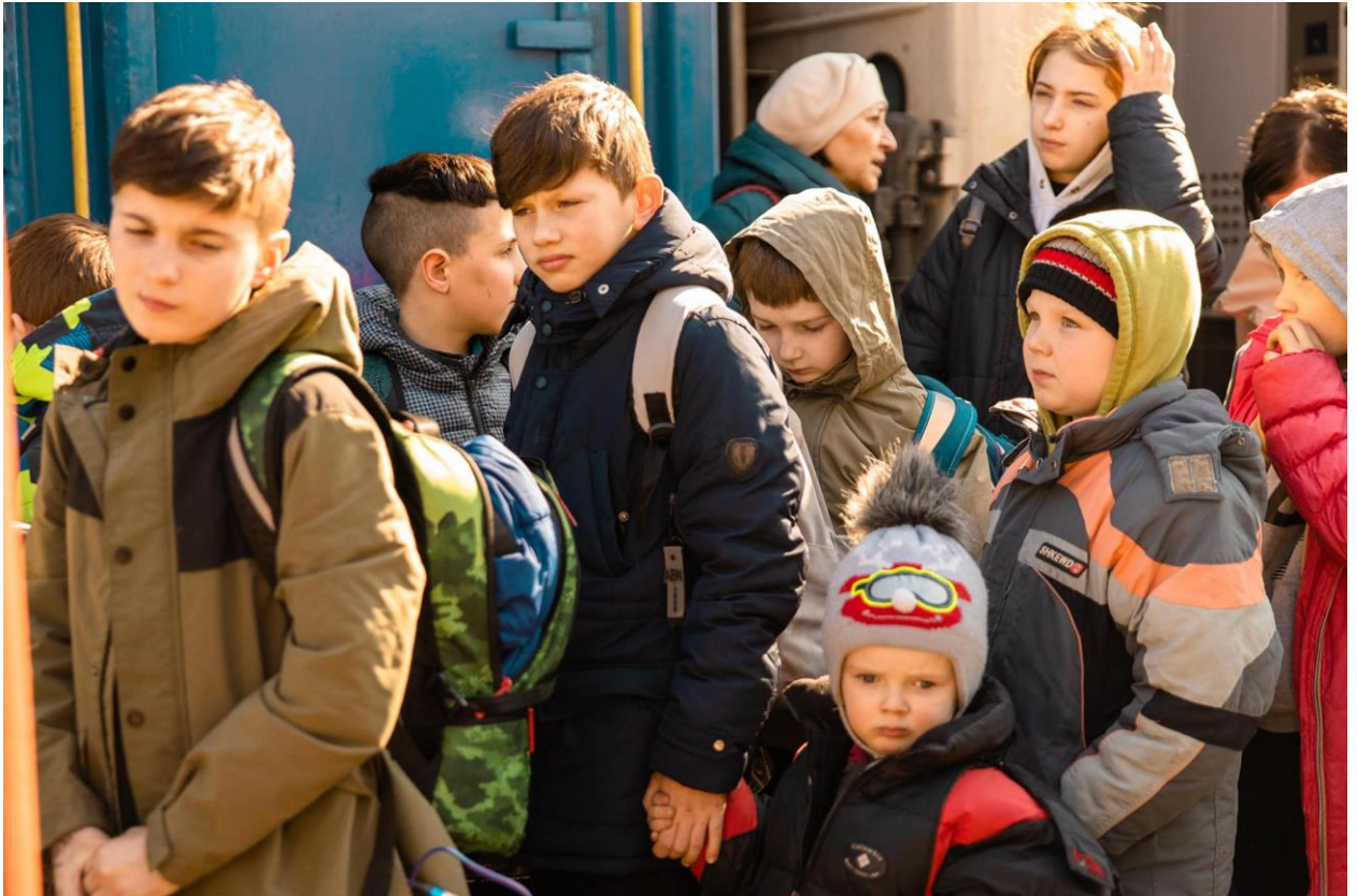
Фото эвакуации воспитанников Черниговского интернатного учреждения 54

находятся дети, отказываются переводить их в безопасные места, не координируют свои действия с областными военными администрациями и центральными органами исполнительной власти. Это не вопрос, в котором могут быть дискуссии. Детей необходимо обезопасить. По результатам обсуждений этого вопроса со всеми ключевыми государственными лицами, ответственными за защиту прав детей, я сегодня обратилась с письмом к Премьер-Министру с предложениями по решению этой ситуации» 53 .