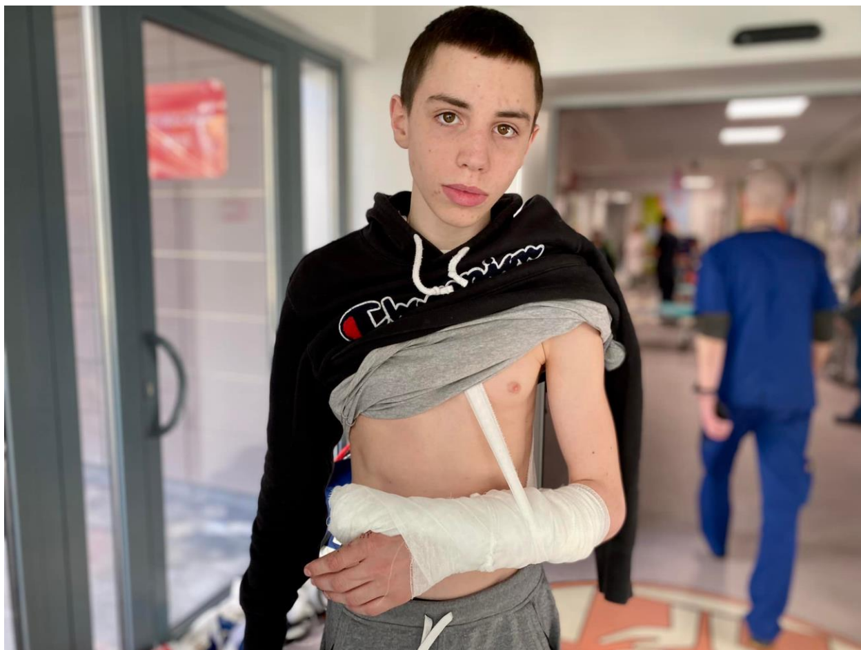
Фото 14-летнего мальчика, который получил ранение от обстрелов российских военных 12 .

17 марта 2022 года российскими оккупантами на глазах 14-летнего сына безжалостно был убит отец многодетной семьи. Мальчик получил пулевые ранения. Это случилось, когда они ехали за гуманитарной помощью и лекарствами в центр оккупированного г. Буча, Киевской области, где проживает семья, потому что в доме семьи почти две недели не было газа, света и воды 11 .