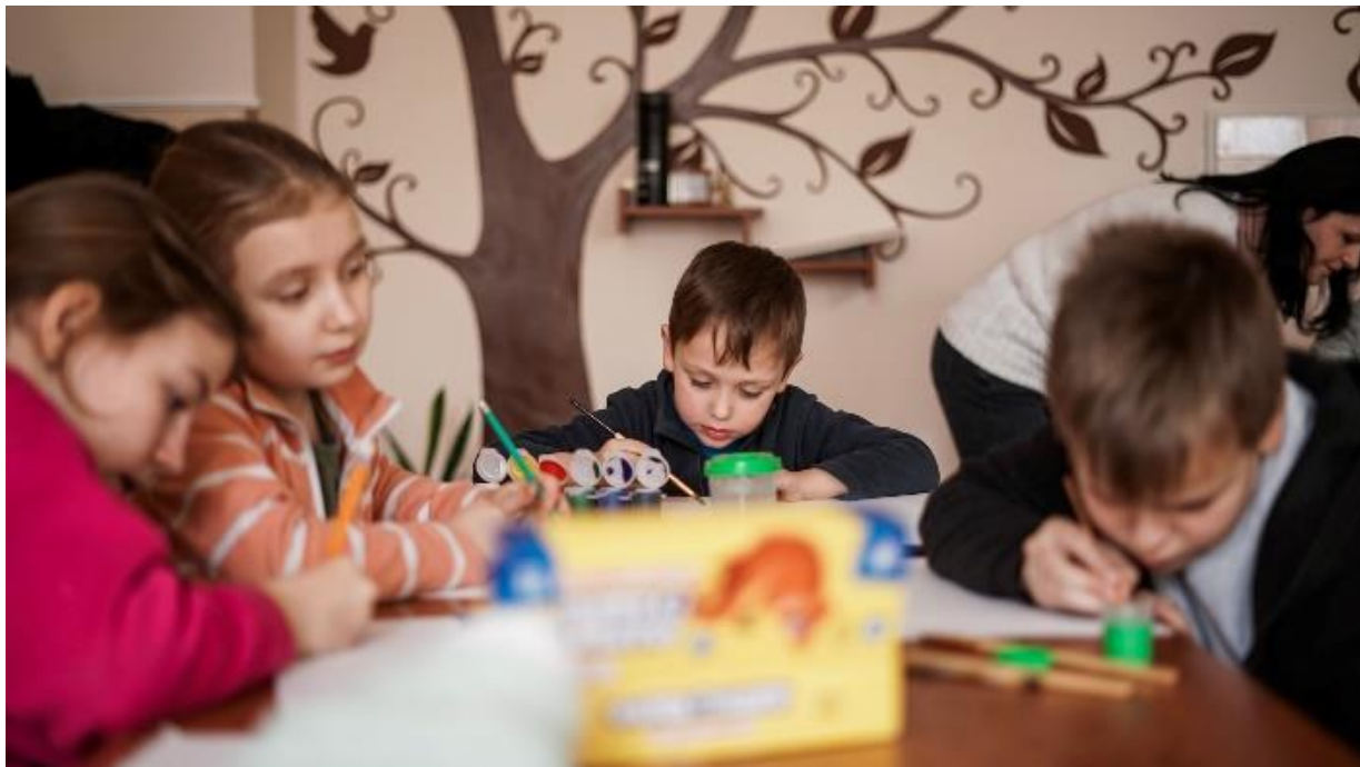
Фото детей в шелтере для ВПО 41

Психологи благотворительной организации «Голоса детей» проводят с детьми в шелтере для ВПЛ в Трускавце занятия по арт-терапии.