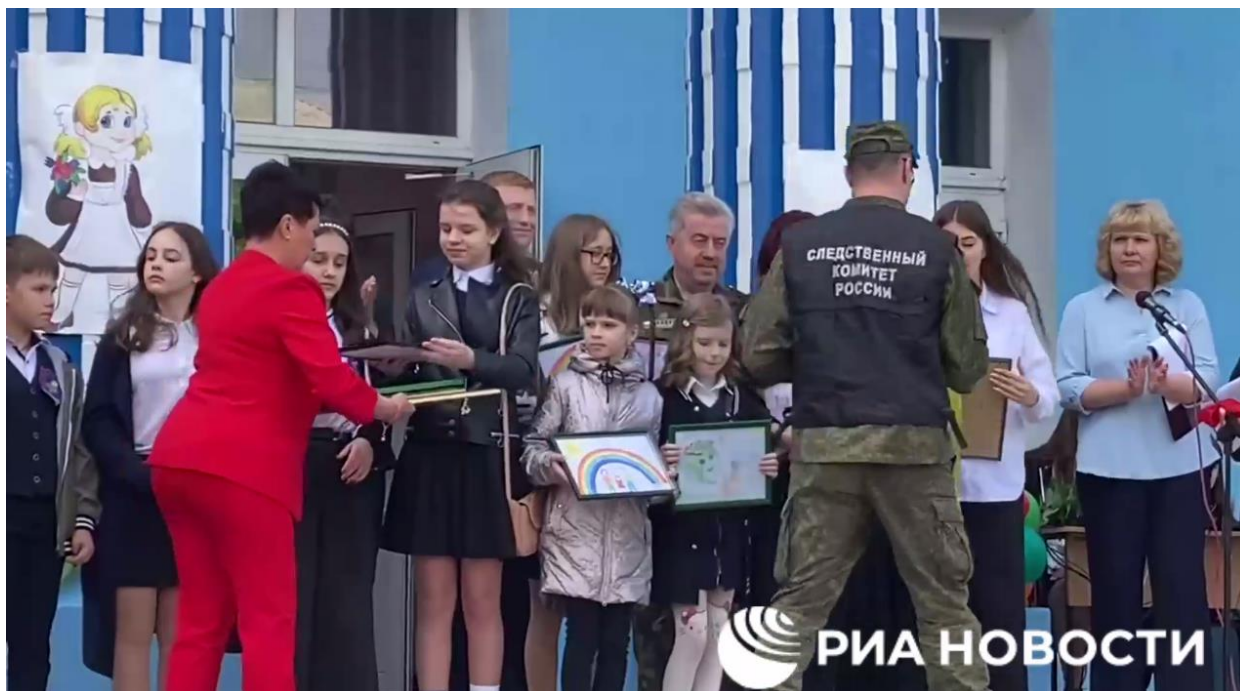
Діти однієї з луганських шкіл дарують малюнки слідчим Слідчого комітету росії 31