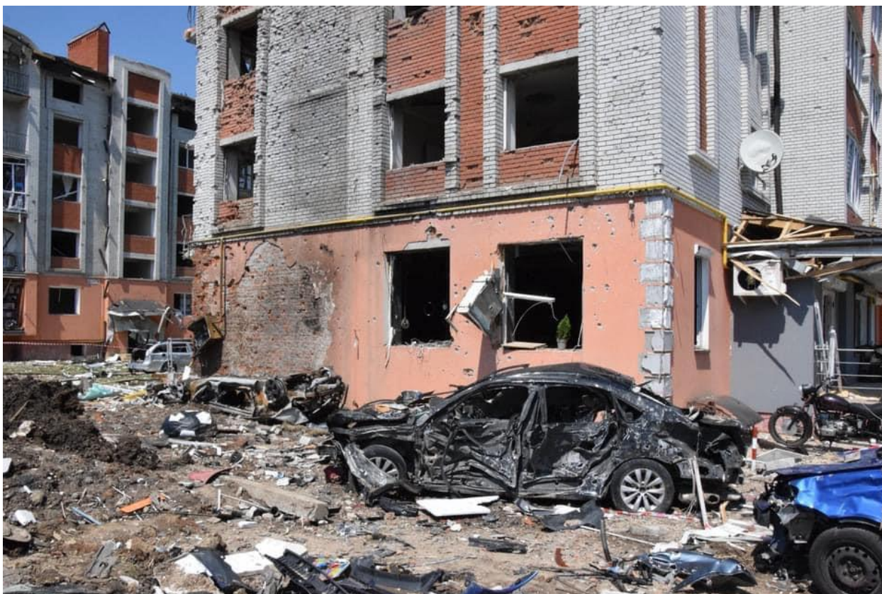
Місто Чортків Тернопільської області після обстрілів 11 червня 61

Питання безпеки важливі й для організації освітнього процесу в очному форматі, який планується запровадити з 1 вересня в більшості регіонів України. Станом на 20 червня лише в 25% шкіл підтверджено наявність укриттів 62 .