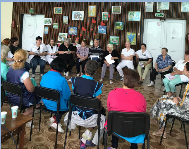
На фото: тренінг «Психологічні методи самопомоги»

Також влітку за підтримки ХІСД Центр організації психічної допомоги організував тренінг «Психологічні методи самопомоги» для працівників Бородянського психоневрологічного інтернату. Учасники отримали знання про психологічну травму та як вона може вплинути на особистість людини. Засвоїли також інформацію про реакції у стресовій ситуації (Бій, Біжи, Замри) та як реагує організм людини під час загрози.