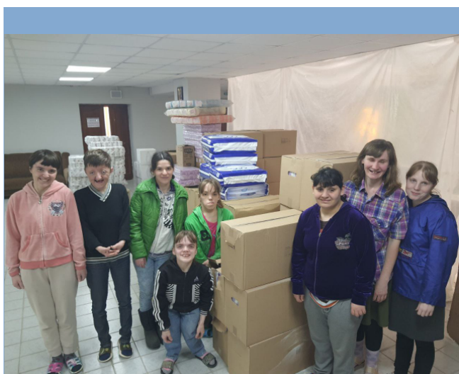
На фото: надана допомога інтернатним установам у Харківській області

з найбільш незахищених, але й при цьому часто забутій категорії громадян – дорослих в інтернатах, які знаходилися поруч з територіями, на яких велися активні бойові дії. Навесні 2022 року ці заклади опинилися на межі виживання через те, що традиційні ланцюжки постачання були обірвані, а резерви таких інтернатів були вкрай обмежені.