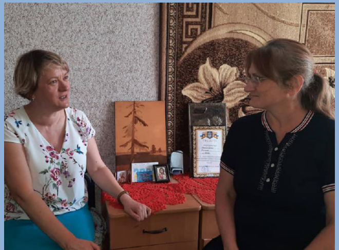
На фото: візит моніторів у Смілянський ПНІ

Восени цього року завдяки підтимці European Disability Forum Інститут розпочав моніторинг дотримання прав людей з інвалідністю у психоневрологічних інтернатах в Україні. Були відвідані 20 закладів та проведені більше 80 інтерв'ю з персоналом, мешканцями інтернатів та експертами у темі захисту прав людей з інвалідністю. Наступного року [2023] планується написання звіту та вироблення дієвих рекомендацій для влади щодо поліпшення умов проживання в дорослих стаціонарних закладах під час війни.