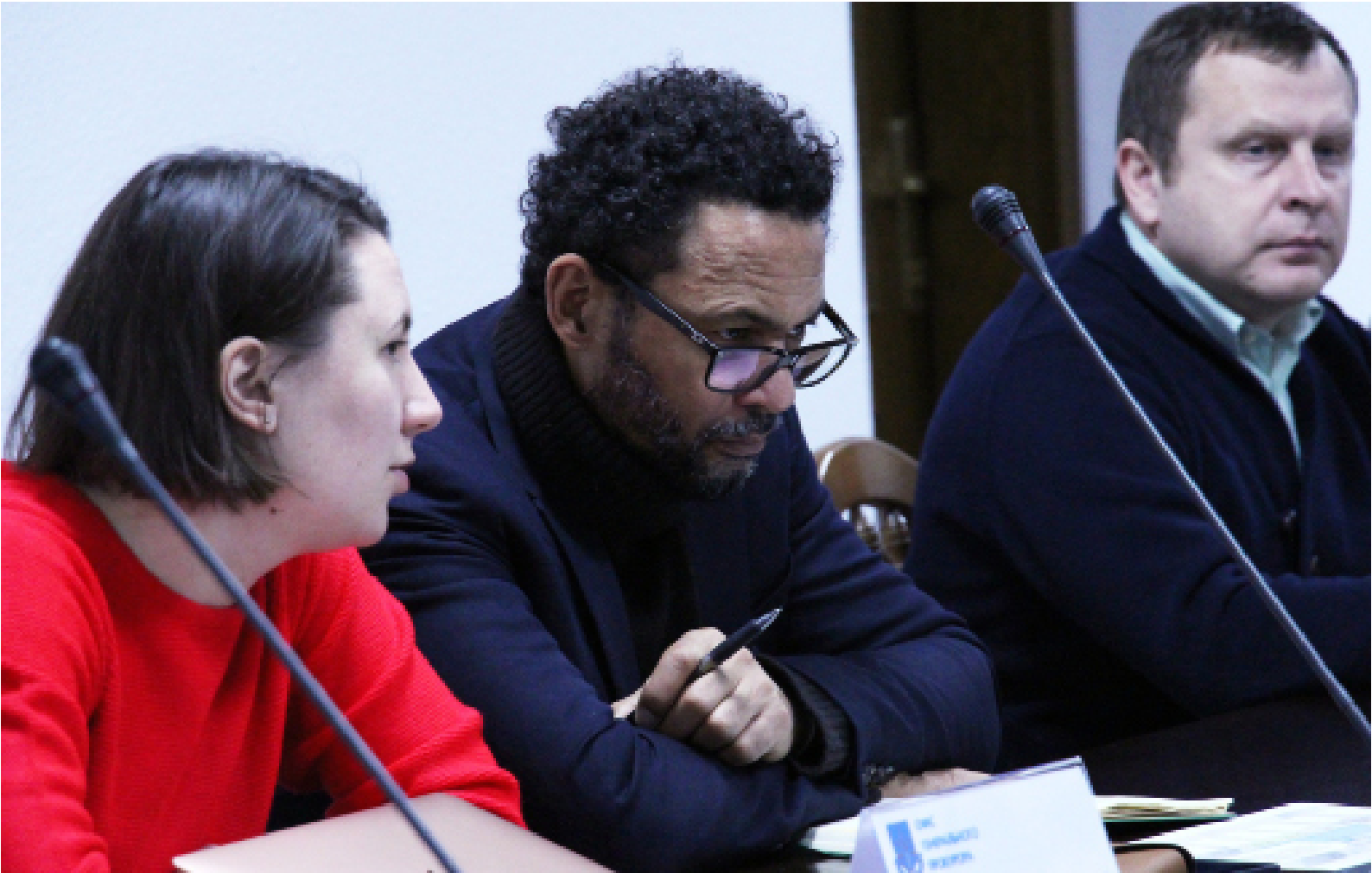
На фото: засідання МРЕ в Офісі Генерального прокурора України

Члени ХІСД також неодноразово упродовж року адвокували дотримання прав дітей та притягнення до відповідальності російських злочинців на міжнародних майданчиках та у звітах.