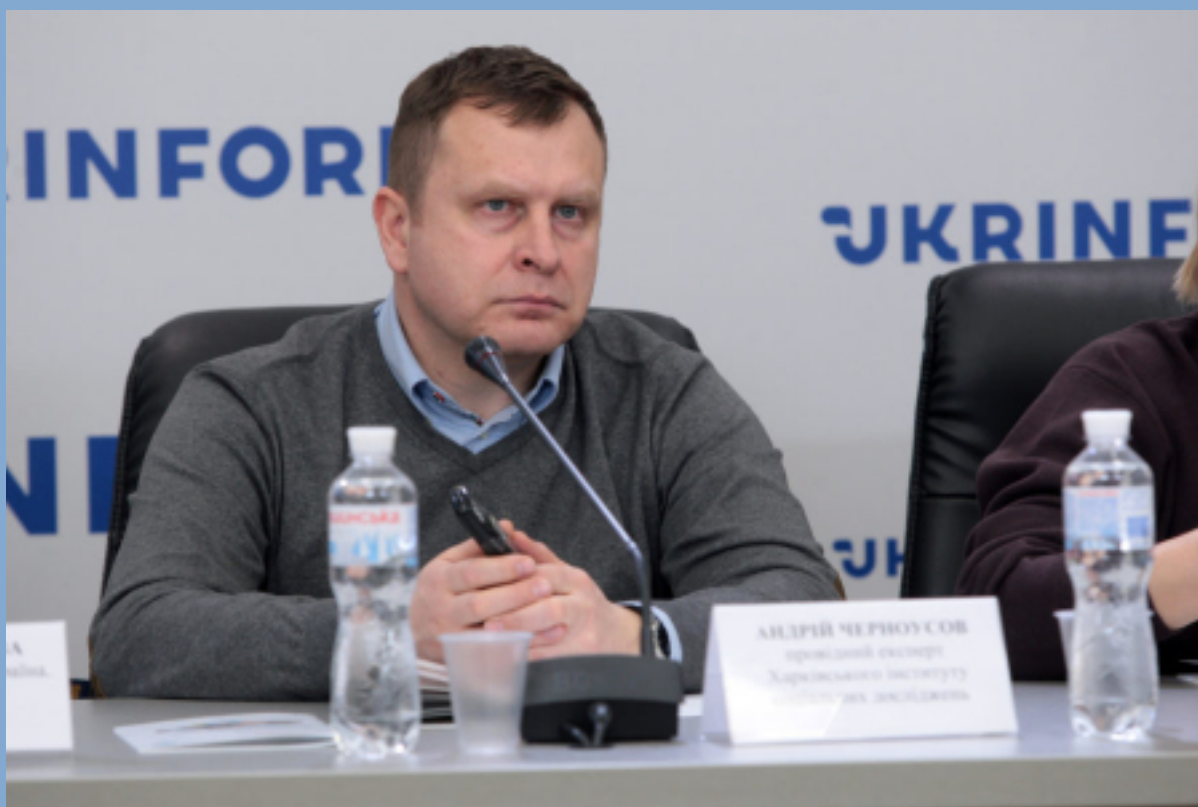
На фото: презентація результатів опитування в Укрінформ

Республіки Чехія. Було опитано більше 3000 респондентів шляхом кількісного опитування. Ми проаналізували, якою має бути перемога України та чи вірять українці у повернення всіх окупованих територій під контроль держави; як українці ставляться до громадян, які співпрацювали з окупаційною владою, яким має бути післявоєнне правосуддя; чи можливі, на думку опитаних, післявоєнні конфлікти між різними категоріями українців; що стане головним викликом для громадян після перемоги та з якими наслідками війни доведеться боротися.