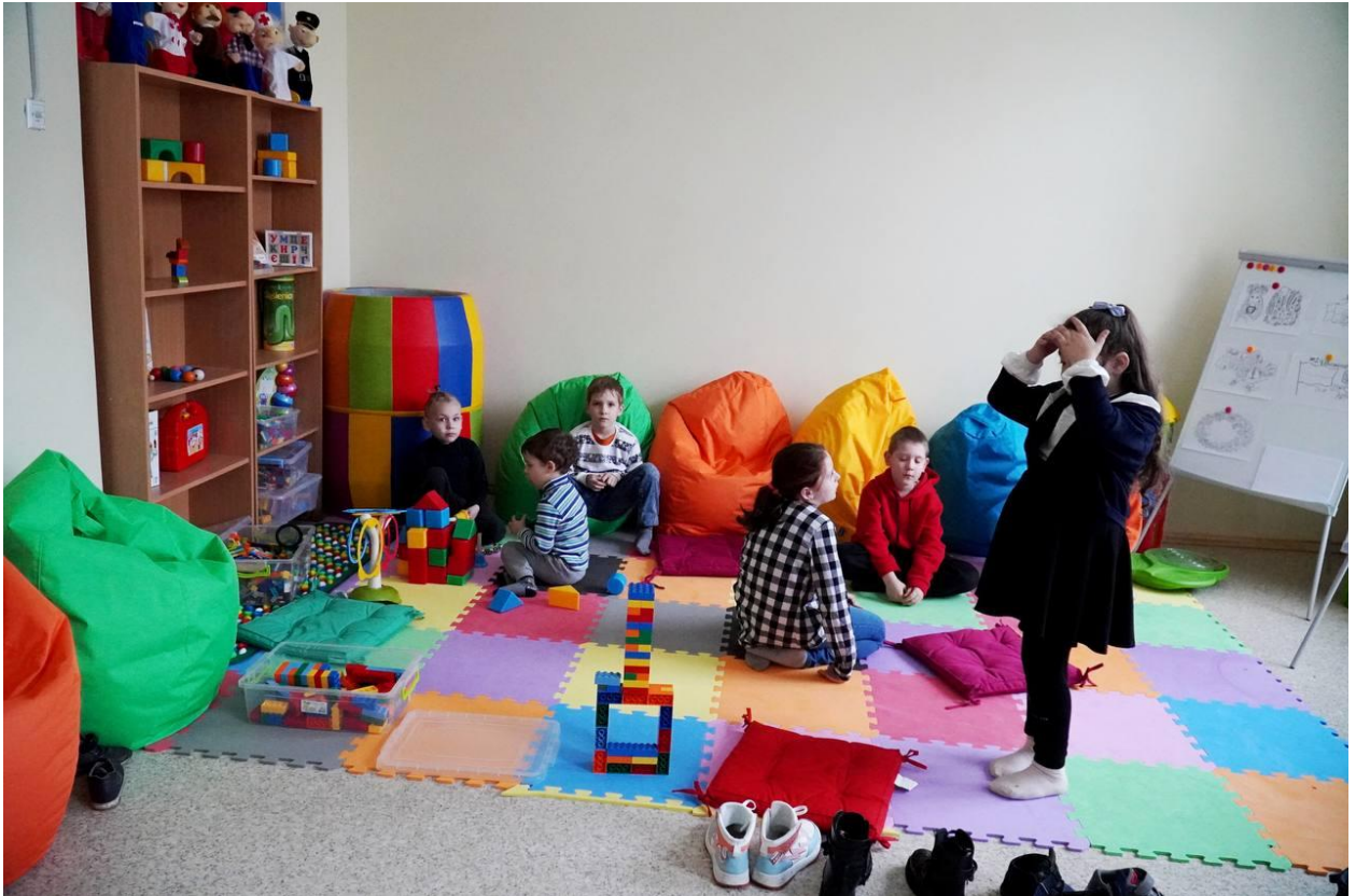
Дитяча кімната в пункті незламності в Одеській області 61 .

Задля надання першочергової допомоги людям в умовах вимкнення світла й опалення станом на 24 листопада в регіонах вдалося розгорнути 4 тисячі «Пунктів незламності» 60 . Це спеціально облаштовані місця, де передбачається наявність тепла, води, електроживлення й інтернету. Також деінде обладнані ігрові кімнати для дітей.