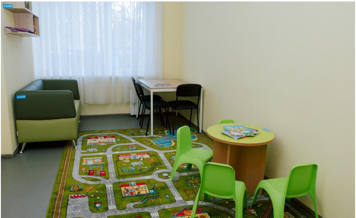
Центр Барнахус у Києві 40

18 листопада прокурори органів прокуратури Херсонської області спільно зі слідчими поліції встановили, що у квітні 2022 року під час окупації зс РФ одного із сіл Херсонського району, російські військові розстріляли в будинку сімох цивільних. Після цього окупанти підірвали будинок з розстріляними людьми. За попередньою інформацією, у будинку перебували працівники фірми, які охороняли поблизу села зрошувальні агрегати, а також неповнолітня дівчина. Загиблих поховали поблизу місця події, а дівчину — батьки на місцевому кладовищі 39 .