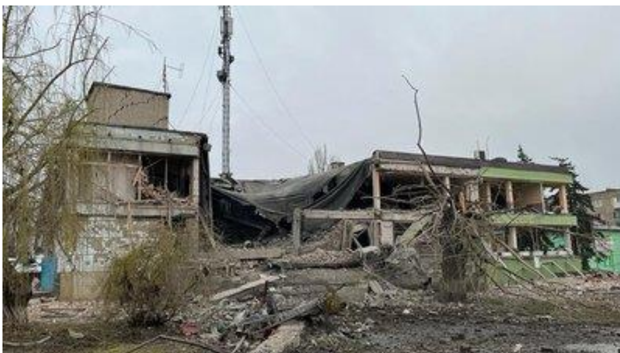
Наслідки удару по м. Курахове Донецької області 40

25 березня російські війська обстріляли м. Часів Яр на Донеччині з РСЗВ «Град» і артилерії. Загарбники використовували фосфорні заряди. Загинув чоловік 39 .