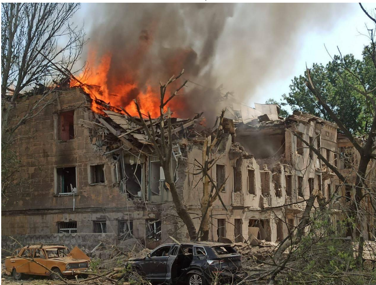
Медзаклад після влучання російської ракети, м. Дніпро, 26 травня 22

15 березня близько 10:00 російські військові завдали ракетного удару по Шевченківському району Харкова. Унаслідок ворожого обстрілу частково зруйновано освітній заклад. У житлових будинках навколо вибито шибки. Пошкоджено автомобілі мешканців 21 .