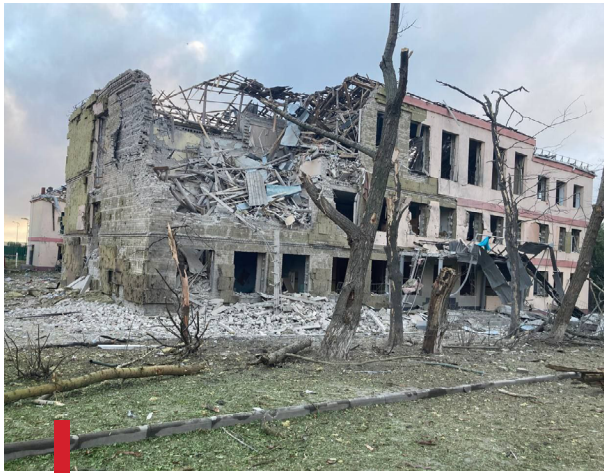
Зруйнована школа в Краматорську Донецької області, 21 липня 15

Станом на 8 лютого через бомбардування та обстріли збройні сили рф пошкодили 3126 закладів освіти . 337 з них зруйновано повністю 12 . Унаслідок російської агресії збитків зазнали близько 1500 об'єктів культурної спадщини та культурної інфраструктури 13 . Станом на 25 січня зруйновано 171 об'єкт медичної інфраструктури і ще 1035 – пошкоджено внаслідок російських атак 14 .