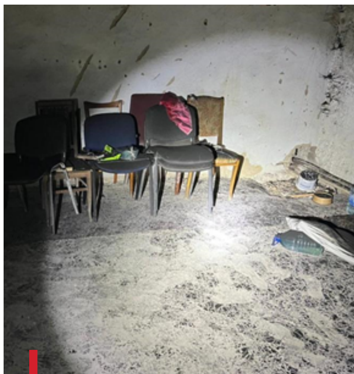
Катівня окупантів у Херсоні 47 .

18 листопада в селі Комиш-Зоря Запорізької області військовослужбовці рф розстріляли впритул родину разом з двома дітьми віком 5 та 14 років у власному житловому будинку 44 .