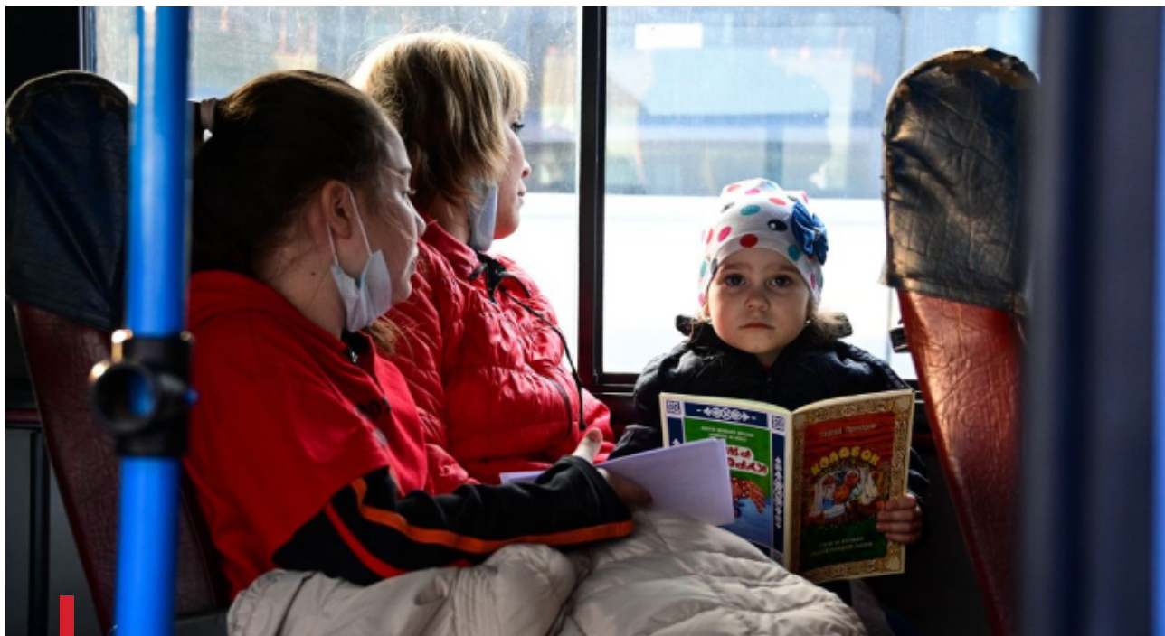
Депортація жителів Маріуполя в Росію 58

«відвідування ялинки та запрошення на свята до російських міст». Наявна депортація дітей, які виховуються в закладах інституційного догляду.