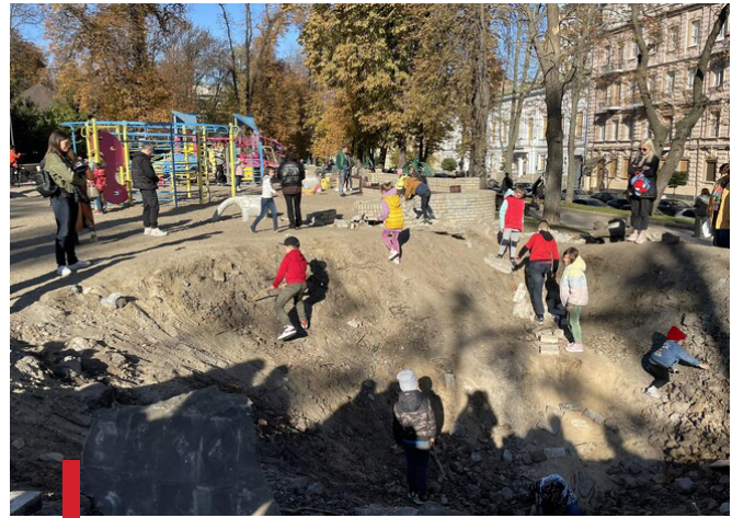
Діти бавляться у вирві на дитячому майданчику в Києві, куди 10 жовтня прилетіла російська ракета 16

Так, 27 червня збройні сили рф завдали ракетного удару по Кременчуку Полтавської області, унаслідок чого був цілковито зруйнований цивільний об'єкт – торговельний центр «Амстор». 22 людини загинули, 64 – постраждали, серед них дев'ятирічна дитина 17 .